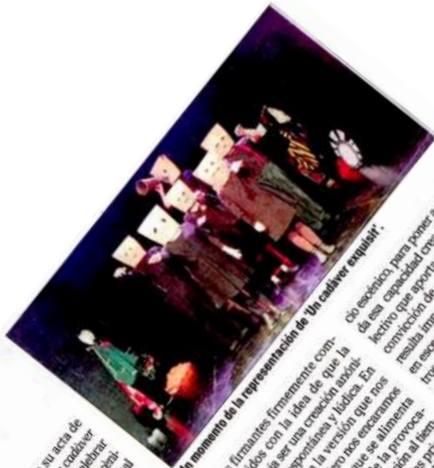
Un momento de la representación de 'Un cadáver exquisit'.

Este juego 'exquisito' no se entendería sin el manifiesto Dada, algunos