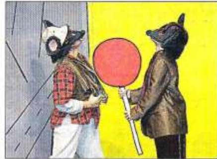
ELS ANIMALS PRENEN EL TEATRE. La faula del ratolí de camp i el ratolí de ciutat, o la faula de l'ase i el lleó són algunes de les narracions maravelloses que la companyia Estudi Zero Teatre representa aquests dies al Teatre Municipal de Palma.