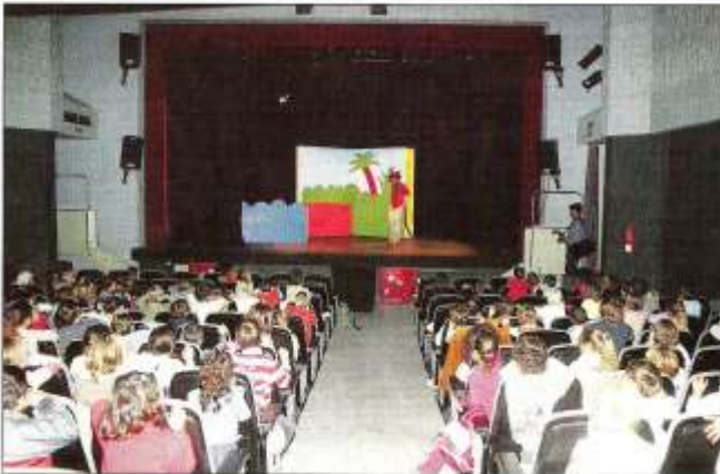
Los más pequeños llenaron ayer el Teatre Municipal de Palma.