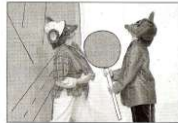
Los animales son los protagonistas. El teatro JORDY.

presentará «Rases», espectáculo que une la danza contemporánea y los dibujos animados de Max; Teatro de la Sergantana, con «La fabulosa ciencia del