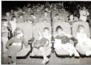
Los primeros espectadores, ayer en el teatro.

les faules» es un espectáculo dirigido al público infantil e incluso en edad preescolar, un recorrido por el fascinante mundo de las fábulas. A partir de un cuento abierto a los niños empieza la aventura explorando la fauna de las fábulas con un toque cómico y colorista buscando una complicidad con los niños y con sus acompañantes. El