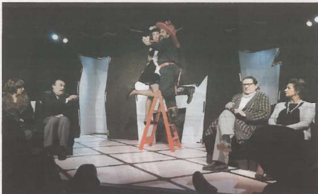
Todos los personajes de esta trama sin trama se encuentran en escena.