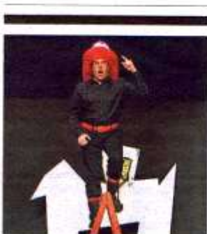
'La cantant calba'.