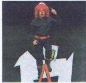
'La cantant calba'.