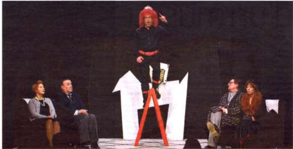
Escena de 'La cantant calba', d'Eugène Ionesco, representada pels actors i les actrius d'Estudi Zero ■ ESTUDI ZERO

Certament, l'avantatge d'aquestes "complicitats" entre teatres és que permeten prorrogar la vida de certes obres més enllà de les programacions dels seus teatres i enriquir les agències dels que les acullen. En una conjuntura de crisi econòmica com l'actual, sembla que és l'única sortida del teatre de petit