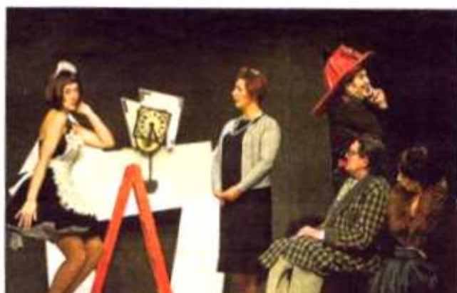
Los actores de Estudi Zero Teatre, en 'La cantante calva'.