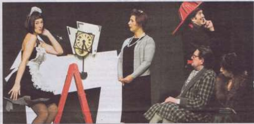
Una escena de 'LA CANTANT CALBA', per Estudi Zero. JORDI GILLETTE

Milions de gràcies i per molts d'anys i bons, teatrezencers!