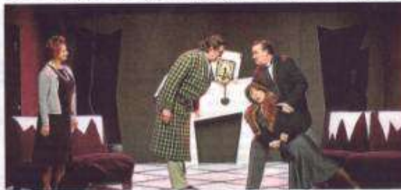
La cantant calba complirà avui els mateixos actors que la viví i crec anys.