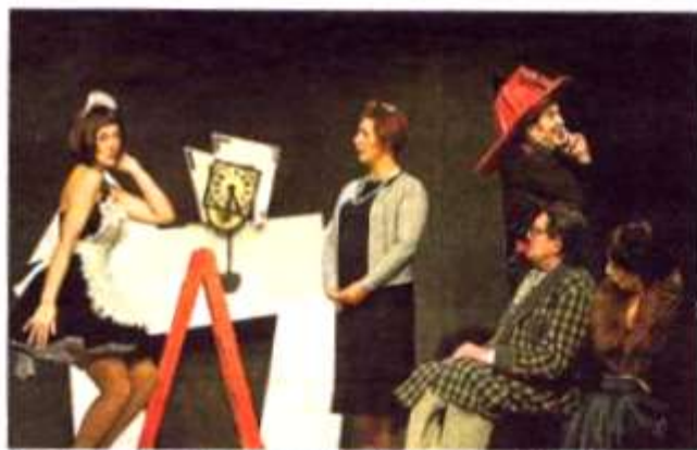
Los actores de Estudi Zero Teatre, en 'La cantante calva'.