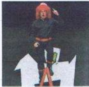
'La cantant calba'.