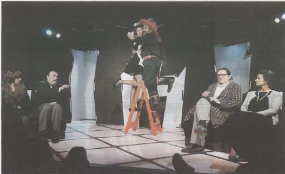
Todos los personajes de esta trama sin trama se encuentran en escena.