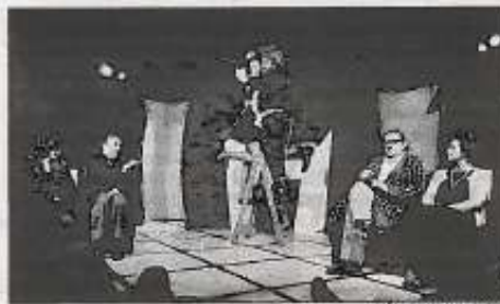
JESÚS MONROY / VI MUESTRA

Las actrices encargadas de dar vida a la Señora Smith y Elisabeth Martin estuvieron fabulosas en su ingenuidad costumbrista, dichas como si caminaran por el agua de puntillas ante cualquier nimiedad que las distrajera, como quien cree hablar con gran propiedad otra lengua y se queda obnubilado escuchando la sonocidad de la pala-