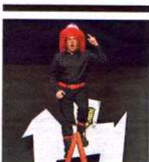
'La cantant calba'.