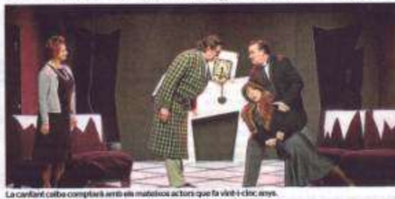
La cantant calba complirà setanta anys amb els mateixos actors que la van interpretar el 1985.