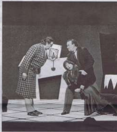
Un momento de la obra La cantant calba , de Estudi Zero Teatre.

Una obra, Poemes irreverents , admirable por su valentía y poder revulsivo sensual. Les dejo con tres versos admirables (sin embargo, camaradas en la utopía, lean el libro sin prejuicios y, a ser posible, apasionadamente): «De nit se m'hi lluminaven els poemes. / Car la bombeta dels trus mugrons / se m'encenia de tant en tant al cervell».