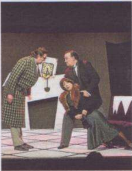
Escena de La cantant calba , de la companyia Estudi Zero.