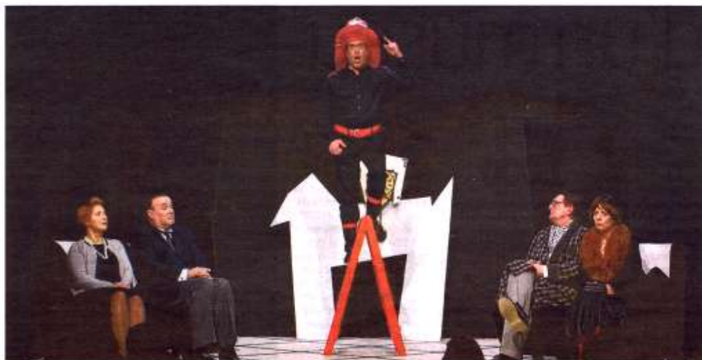
Escena de 'La cantant calba', d'Eugène Ionesco, representada pels actors i les actrius d'Estudi Zero ■ (SILVIA GIMÉNEZ)

Certament, l'avantatge d'aquestes "complicitats" entre teatres és que permeten prorrogar la vida de certes obres més enllà de les programacions dels seus teatres i enriquir les agendes dels que les acullen. En una conjuntura de crisi econòmica com l'actual, sembla que és l'única sortida del teatre de petit