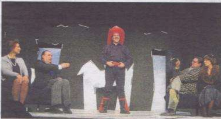
Estudi Zero tornarà a pujar l'obra al Teatre Sans a final de mes i a principi d'abril.